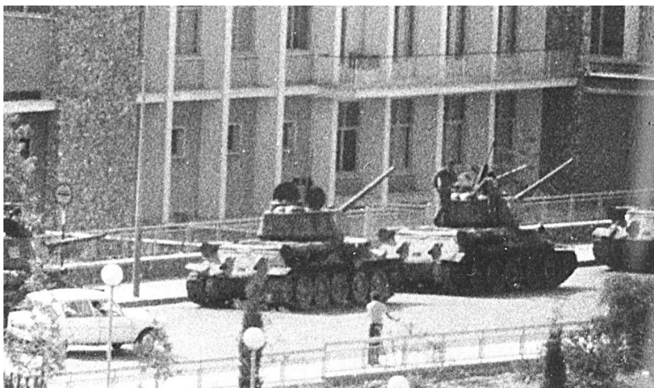
Άρματα μάχης στον δρόμο μεταξύ του ξενοδοχείου «Χίλτον» και της Τεχνικής Σχολής, δίπλα από την οποία βρισκόταν το στρατόπεδο της Εθνικής Φρουράς με την 891 ATX, τη Στρατονομία και διάφορα τμήματα του ΓΕΕΦ.